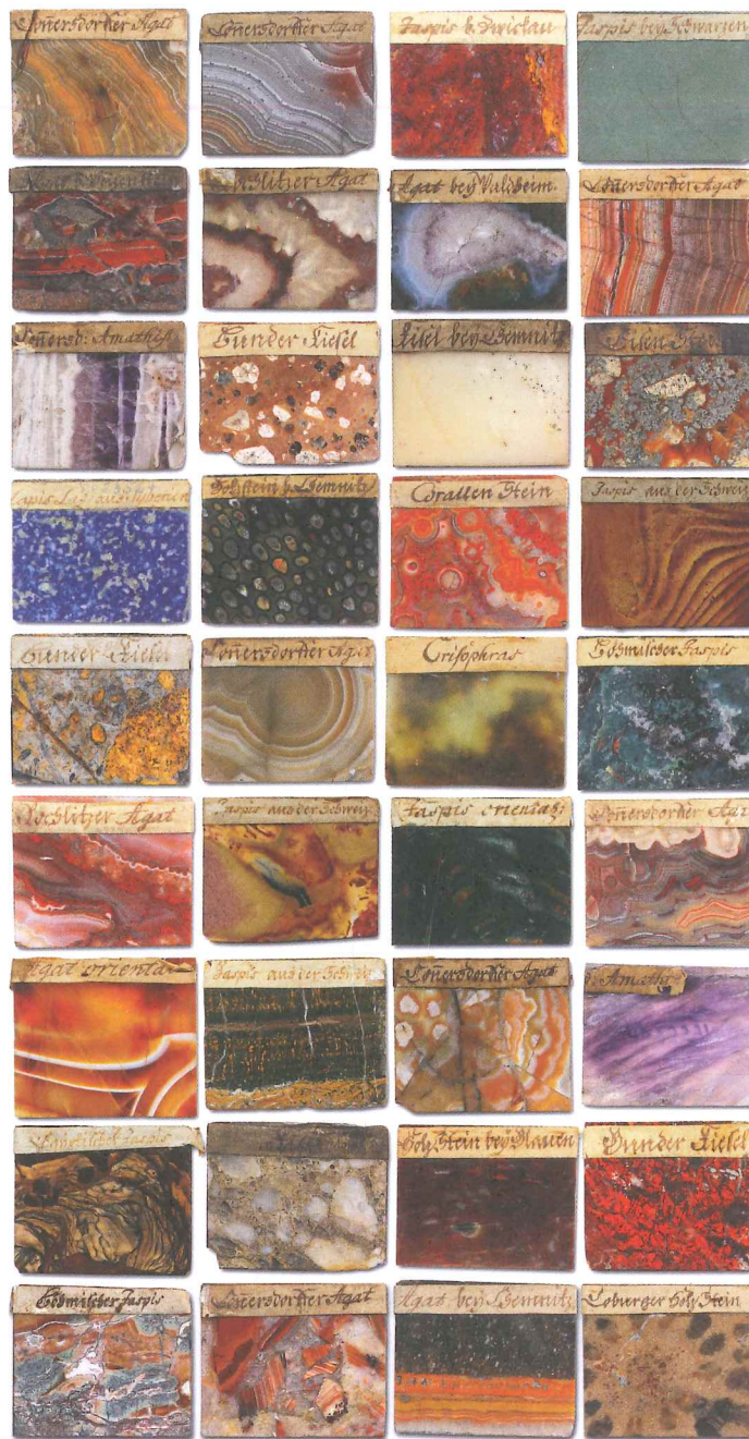
Auswahl von Steintafeln aus dem Taddelschen Steinkabinett, Heinrich Taddel, Dresden vor 1757, verschiedene Schmucksteine, ca. 4,3×3,2 cm, Inv.-Nr. I 115 a, b

Begleitend zur Ausstellung erscheint ein Katalog im Sandstein Verlag Dresden. Es ist die erste Heinrich Taddel gewidmete Publikation. Zudem stellt sie hinsichtlich der engen Kooperation zwischen Grünem Gewölbe und TU Bergakademie Freiberg ein Beispiel für die Museum und Universität verschränkende interdisziplinäre Forschung dar. ISBN 978-3-95498-751-1