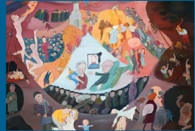
Nöte der Zeit, 1948, Öl auf Holz, Städtische Museen Zittau, Inv.-Nr. 12256/60