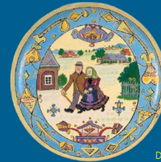
Altes Lausitzer Paar, bemalter Teller, o. J., Öl auf Holz, Städtische Museen Zittau, Inv.-Nr. 9042/71