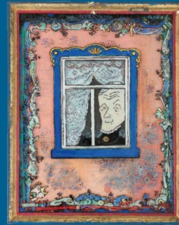
rechts: Alte Frau am Fenster, o.J., Hinterglasmalerei, Heimatmuseum der Stadt Herrnhut, Inv.-Nr. 2670