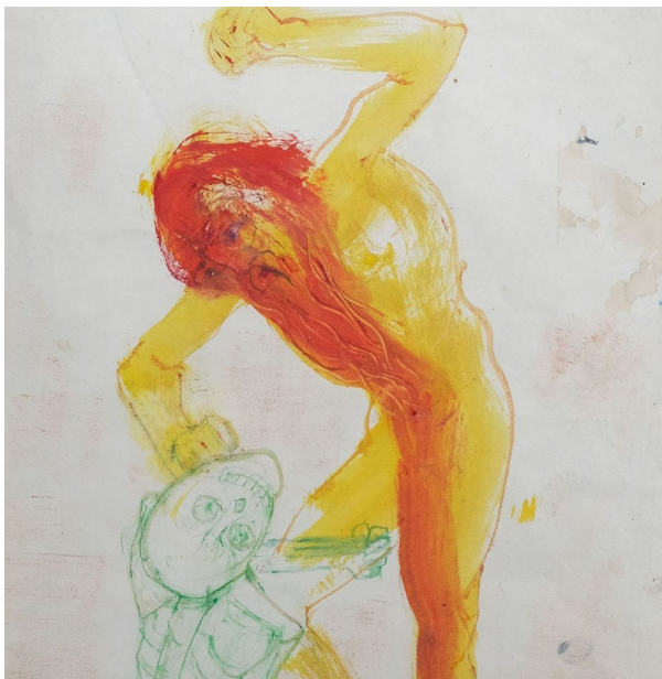
Abbildung in: Märchen der Brüder Grimm. Mit Illustrationen von Josef Hegenbarth, Leipzig 1976, S. 464f.