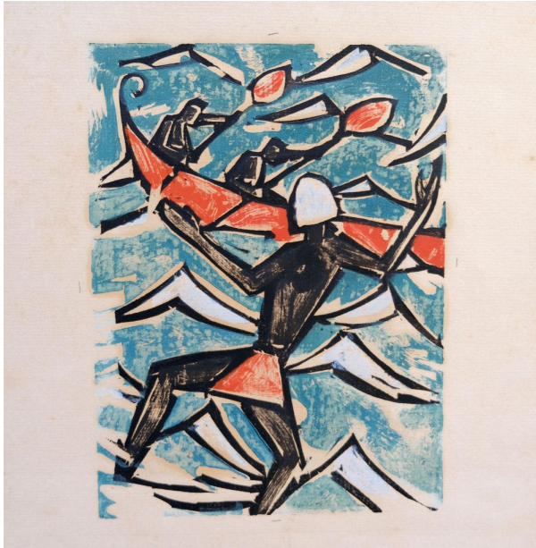
Beschreibung - Otto Lange